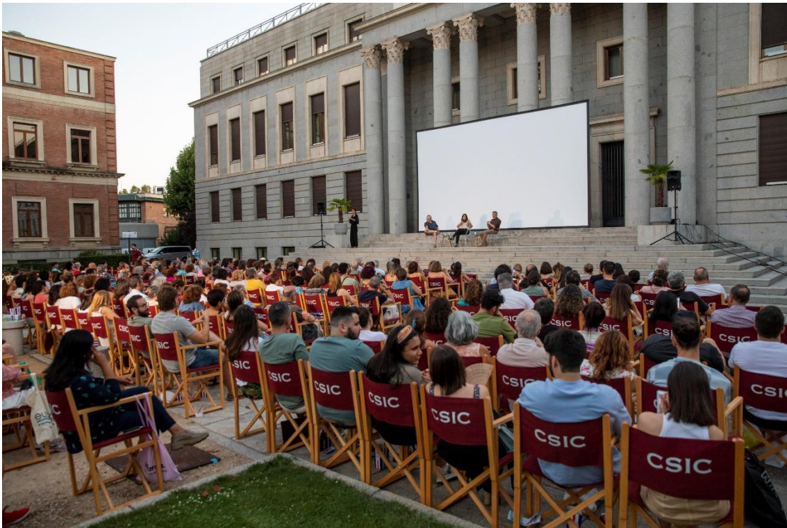
Imagen de la 2ª edición de CSIC de Cine.

El mar es el protagonista de la tercera edición de CSIC de Cine , el cine de verano del Consejo Superior de Investigaciones Científicas (CSIC). Por eso su programación arranca con un clásico que tiene al océano, sus misterios y peligros como grandes protagonistas: Tiburón (1975), de Steven Spielberg, que se proyecta este viernes 5 de julio en la plaza central del CSIC en Madrid .